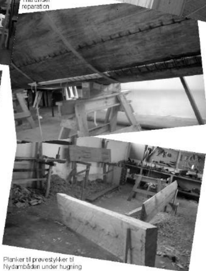
Planker til prøvestykker til Nydambåden under hugning