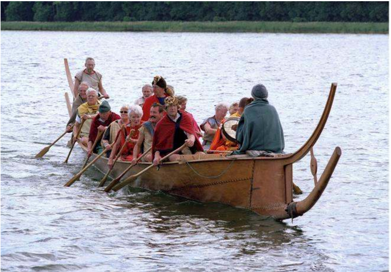
Tilia set fra Sottrupskov