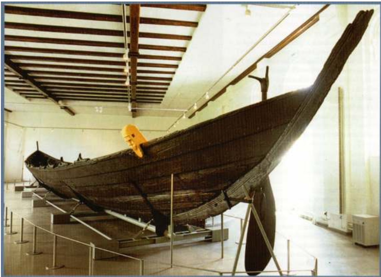
Nydambåden på Gottorp slot