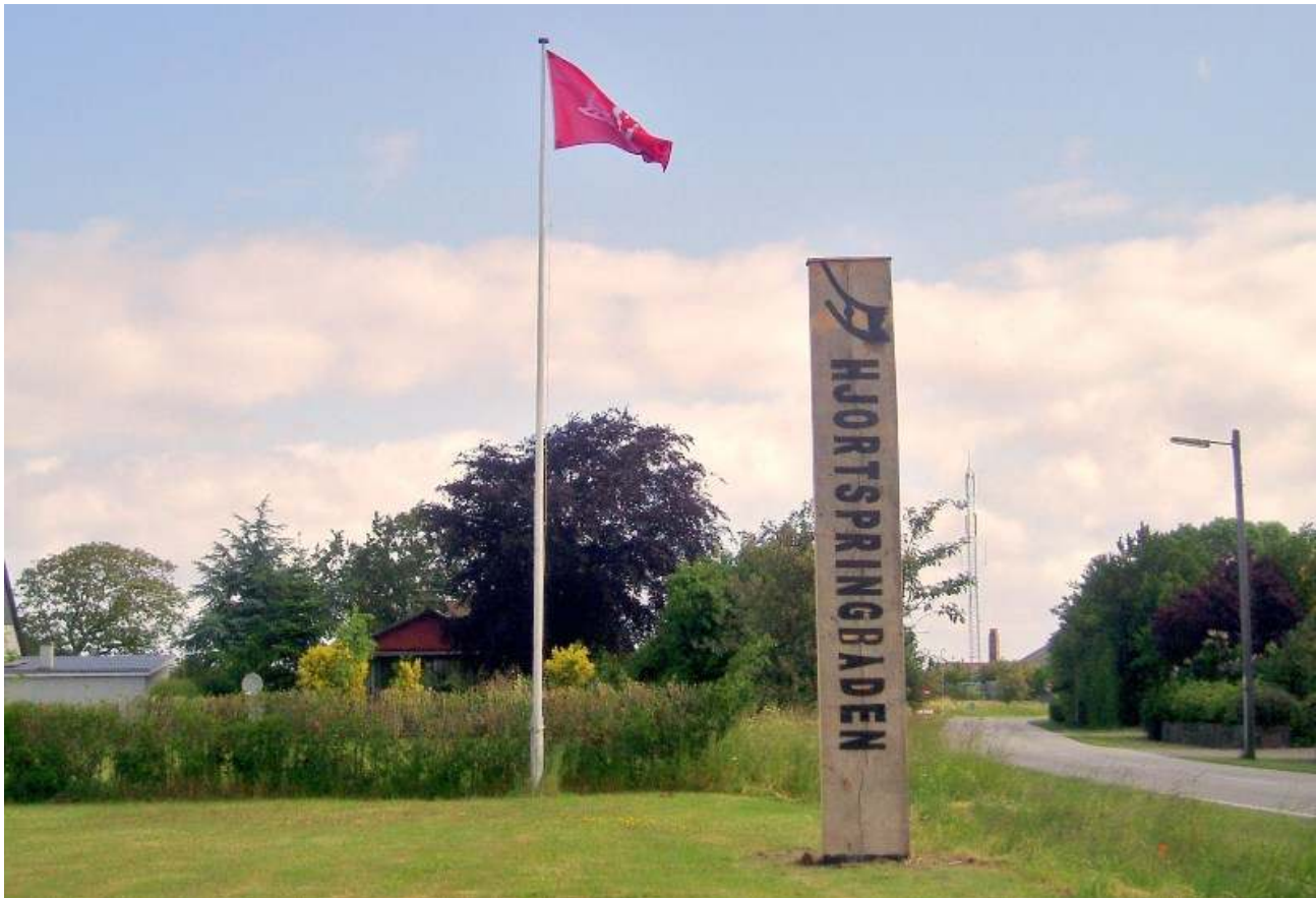
Vi har fået et nyt skilt ved værftet