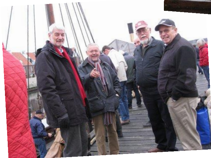
Faglige drøftelser i Frederikssund Havn