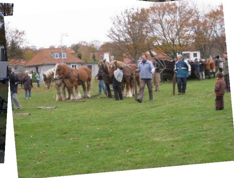
Bådene rulles over græsarealet til oplægningspladsen foran museet