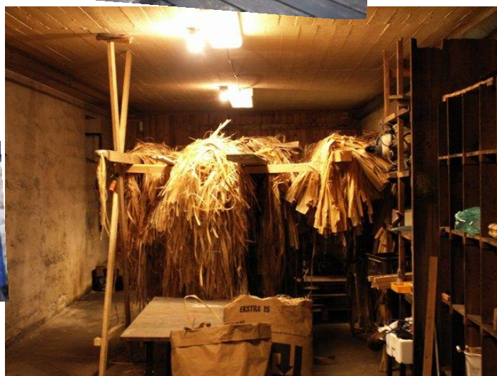
Lindebastlageret i Vikingeskibslaugets værksted

Vikingeskibslauget Sif Ege har udgivet folderen "Lindebast – En vejledning i fremstilling, brug og vedligeholdelse af lindebastov" Redigeret af Ole Illum Hansen Nogle eksemplarer ligger på Lindeværftet