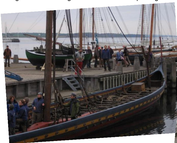
Bådene lægges op for vinteren foran Vikingeskibsmuseet

Der gøres klar til at tage masten ned inden ophaling.