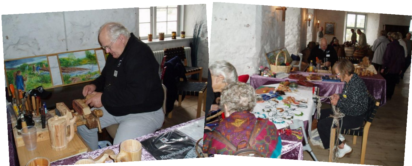
Husflidsudstilling på Sønderborg Slot oktober 2009