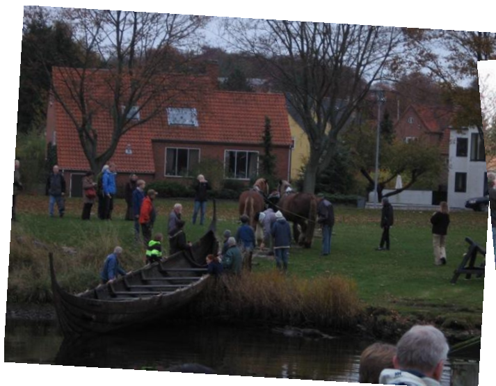
Alt efter bådernes størrelse trækkes de på land af 2, 4 eller 6 heste