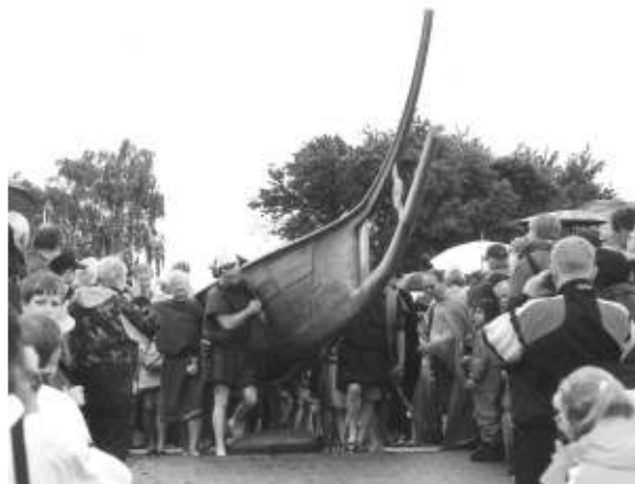
Båden på vej ned af slidsken i Dyvig

Nu er jeg fri. Igen kan jeg hilse på mine gamle venner, bølgerne, og