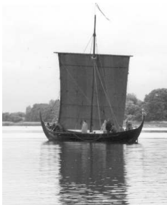
Vikingskibet Freja i Dyvig

Det blev en både hurtig og flot tur hjem. Kl. 21.30 ku’ vi sætte fast i Hejlsminde efter at have deltaget i søsætningen af et smukt – Alsisk? – håndværk.