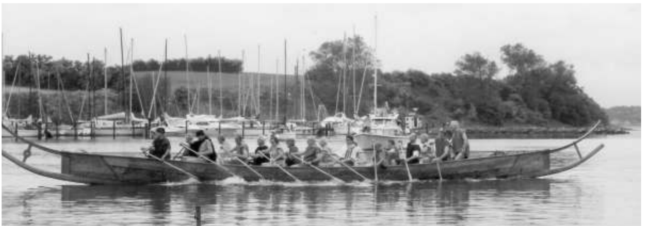
Fart på båden – næsten i takt

Skal siden I henligge til ørne og ravne, som på valen vil mæske sig med jeres kød ! Vid da – at helteløn – det er heltedød !!!