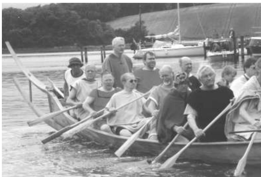
Efter en vellykket sejlads lægger vi atter til ved bådebroen

Svenstruplauget - et lokalråd i Svenstrup - blev indkaldt til dette møde. Ideen blev født om at lave en kopi af Hjortspringbåden. Egentlig ville vi have originalen til låns, men eksperter fik os hurtigt fra den ide; det ville nok have været et endnu større projekt.