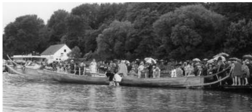
Båden ved roklubbens landgangsbro