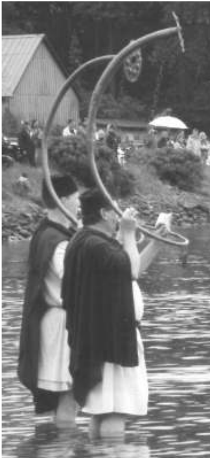
Lurblæserne sendte os af sted med en fanfare