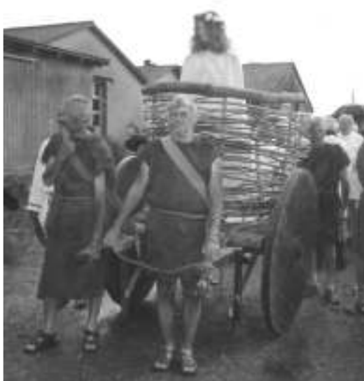
Gudinden Nerthus trukket af 4 slaver

Desværre lykkedes det ikke at få alle biler og tilskuere på plads inden vi startede processionen klokken 14. På det tidspunkt havde regnen været så venlig at dæmpe sig lidt, så der kun var en let regn. Vi måtte hive bundproppen ud af båden, for at få regnvandet ud.