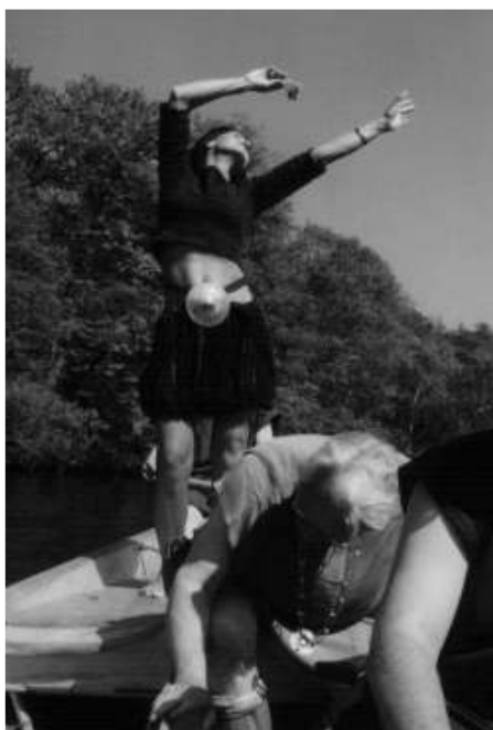
«Egtved-pigen» danser ombord på Tilia