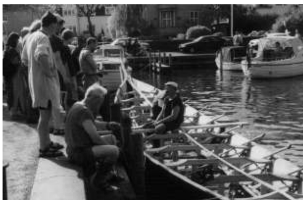
Tilia ved kaj i Silkeborg.

I løbet af lørdagen var vi ude at sejle flere gange. Som tak for hjælpen med at søsætte Tilia var flere af folkene fra Prindsens Hverving og Silkeborg Museum med ude at sejle. Det er en fornøjelse at have folk om bord, der