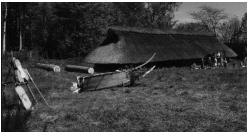
Stævnestykket ved jernalderhuset ved Egtofte.