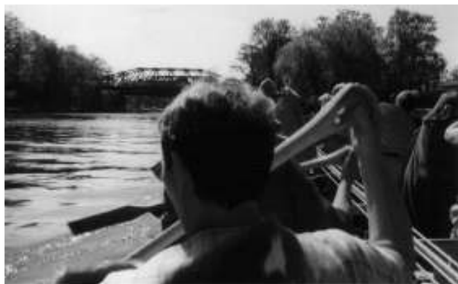
Tilia i fart på Gudenåen

Flere gange i løbet af weekenden optrådte Prindsens Hverving. De opførte et lille skuespil fra jernalderen, der handlede om kampen om sværdet «Blåtunge». Efter skuespillet demonstrerede de anvendelse af forskellige våben fra jernalderen – stenslynger, buer og pile, skjolde, kastespyd, osv. De demonstrerede også anvendelse af heste til kamp. De havde medbragt et antal islandske heste, som er bevaret raceren i over 1000 år på Island, så det er den hest, der kommer tættest på datidens heste.