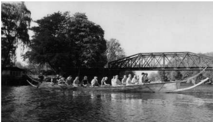
Tilia med besætning på Gudenåen.