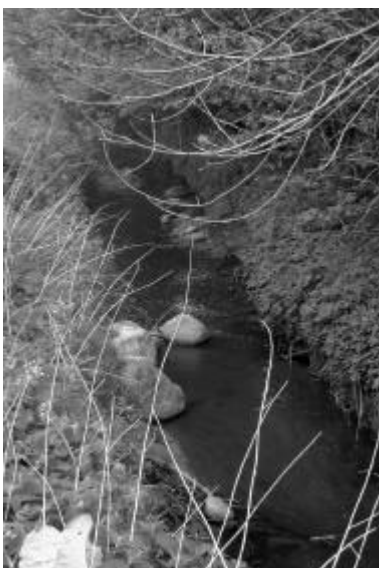
Der er mange smukke steder langs bækken