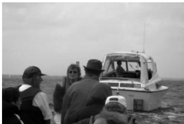
På slæb på hjemvejen