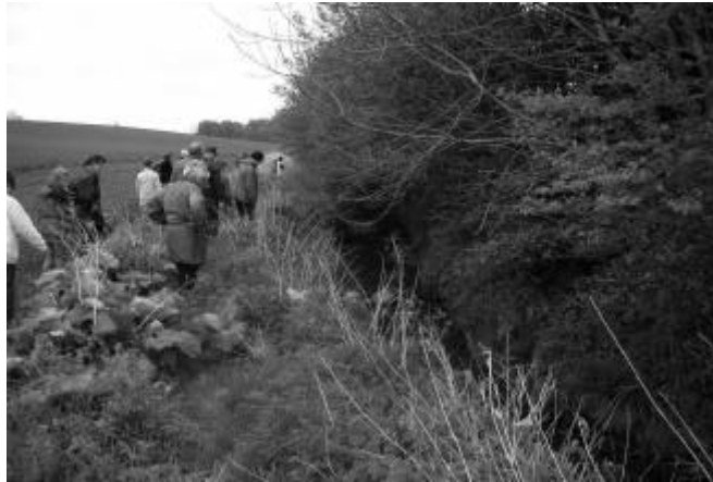
Spadseretur langs Stolbro Bæk

Vi fulgte bækken indtil Møllehøjvej, hvor vi holdt rast. Herfra kunne vi ikke følge bækken, fordi den er rørlagt på det sidste stykke. Vi fortsatte til landevejen som vi krydsede og derfra gik vi det sidste stykke til Hjortspring Mose, hvor turen sluttede.