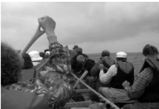
På vej ud af Dyvig

Trætte og glade kørte vi den i hus og hængte vore nye svømmeveste på plads i skabet ca. klokken 17.