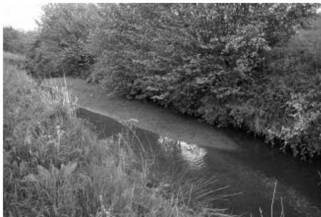
Det er ikke alle steder båden kan komme forbi i dag