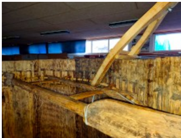
Midterstykke under genopbygning

Vores bestående sysnor var ikke lang nok, så der blev fremstillet endnu en længde. Når snoren er spundet, bør den strækkes, og det har vi gjort over Tiliias horn med en vægt (en kædetalje) i spanden.