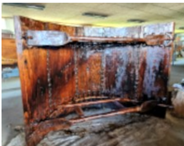
Det færdigbehandlede mellemstykke.

Vores bestående sysnor var ikke lang nok, så der blev fremstillet endnu en længde. Når snoren er spundet, bør den strækkes, og det har vi gjort over Tiliias horn med en vægt (en kædetalje) i spanden.