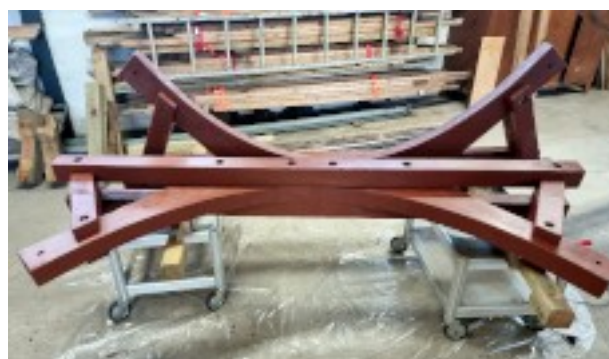
Stativet til mellemstykket er ved at blive malet, svenskrodet.