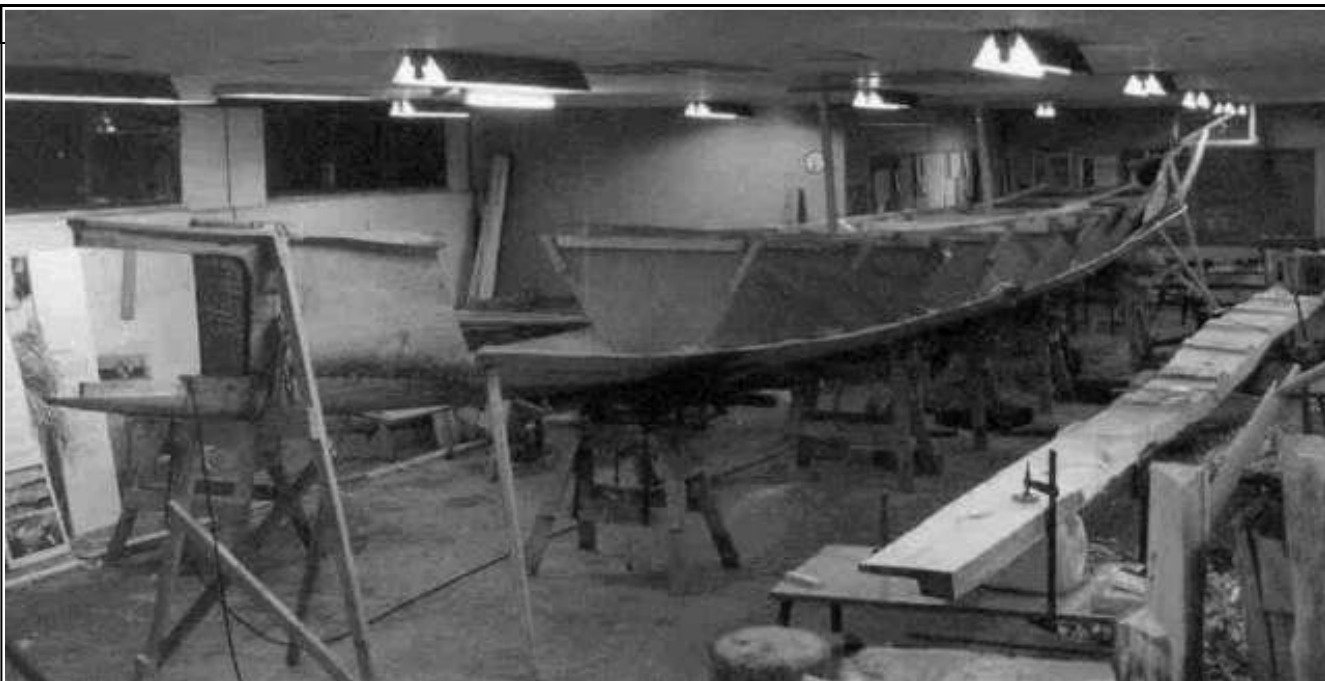
Billede af båden i Lindeværftet, som den så ud i starten af november.